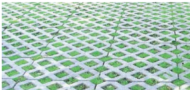
Figure 2 - Les DA installées et ensemencées